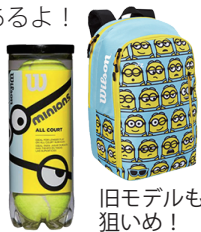
旧モデルも狙いめ！